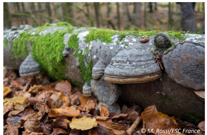
Le service biodiversité en forêt est le plus étudié et le mieux documenté.

Les initiatives de paiements pour ces services ayant déjà été réalisées en France ont également été recensées. Une réflexion a été conduite concernant les principes sur lesquels s'appuient ces paiements (compensation, récompense, principes d'équité et d'additionnalité).