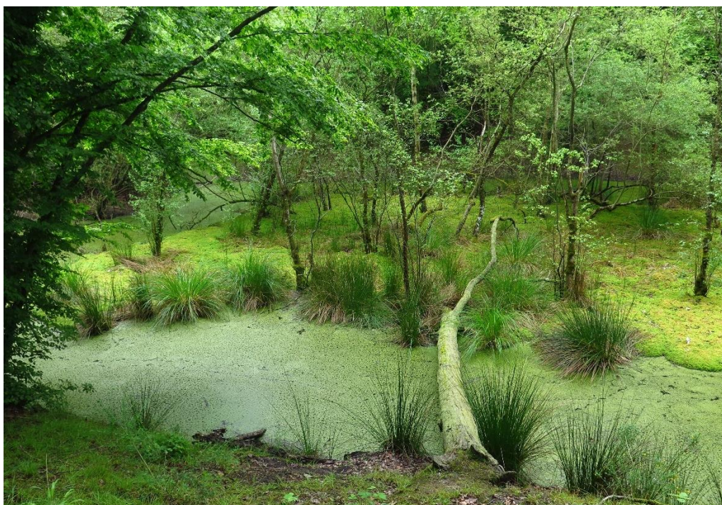
Forêt de Rosny certifiée FSC (Agence des Espaces Verts d'Île de France), © L. Brunier/FSC France.

Comment la prise en compte des services écosystémiques peut aider à valoriser les certificats de gestion forestière FSC ?