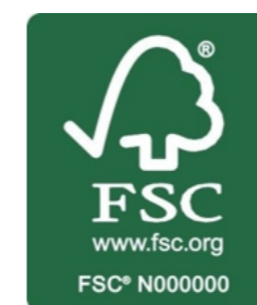
La marque de la gestion forestière responsable

Avec une licence FSC, vous avez la possibilité d'utiliser le panel promotionnel FSC. Vous pouvez choisir la version portrait ou paysage. Vous pouvez afficher les éléments (logo, adresse du site Web, code de licence et déclaration promotionnelle) séparément, mais ils doivent tous être inclus au moins une fois dans une publication. Nous vous recommandons d'utiliser le panel promotionnel afin de vous assurer d'inclure tous ces éléments.