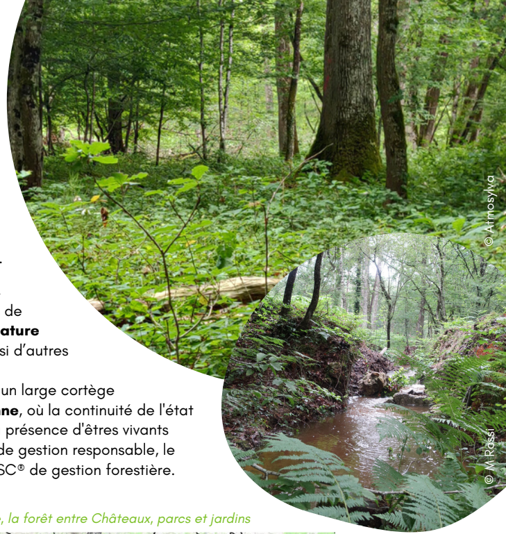
Vallée de la Loire, la forêt entre Châteaux, parcs et jardins

Dans le prolongement de cet engagement, le propriétaire a souhaité, avec l'aide du Cabinet Béchon et d'Atmosylva, mettre en valeur ces actions grâce à la procédure FSC Services Ecosystémiques et a reçu la mention pour les services biodiversité et sol en janvier 2023.